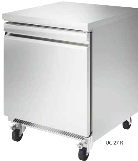
UC 27 R